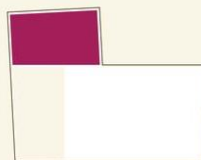
situatie begane grond

Alle informatie is geheel vrijblijvend. Aan deze informatie kunnen geen rechten worden ontleend.